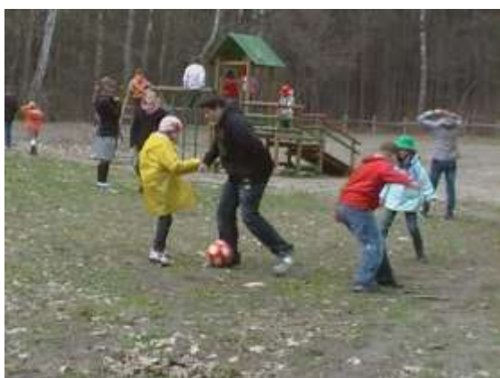
Rajd „Szukamy Wiosny”