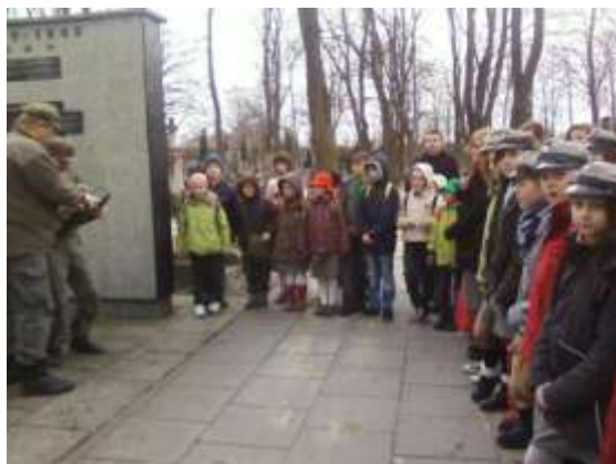
Rajd „Szlakiem Szarych Szeregów” - Warszawa