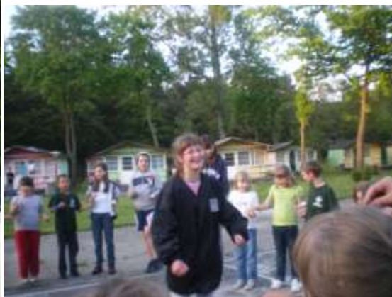
Na biwaku:1-ZOO, 2-NA TERENIE Ośrodka Neptun