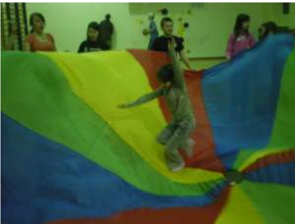
Turniej Antka Cwaniaka