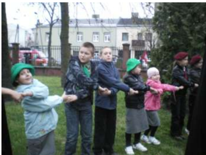
Po mszy za tych, co zginęli.

20 kwietnia byliśmy z wizytą u p. Starosty – zwiedzaliśmy m.in. piękny nowy budynek Starostwa.