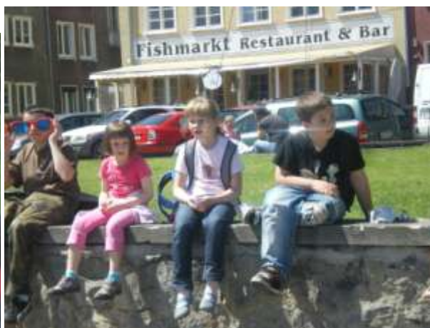
Na czerwcowym biwaku w Gdańsku i Gdyni.