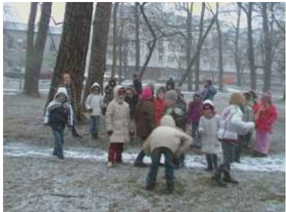
W parku – pomniki przyrody – I dzień Wiosny